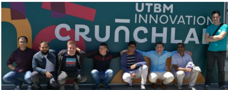
Unser Team nach dem Robotik-Workshop an der TU Belfort-Montbéliard